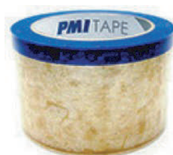
Quick Rip Tape Ref.: #260