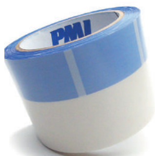
Split Tape Ref.: #451