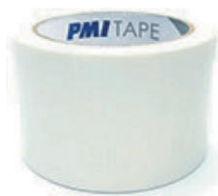
Full Adhesive Tape Ref.: #451FA